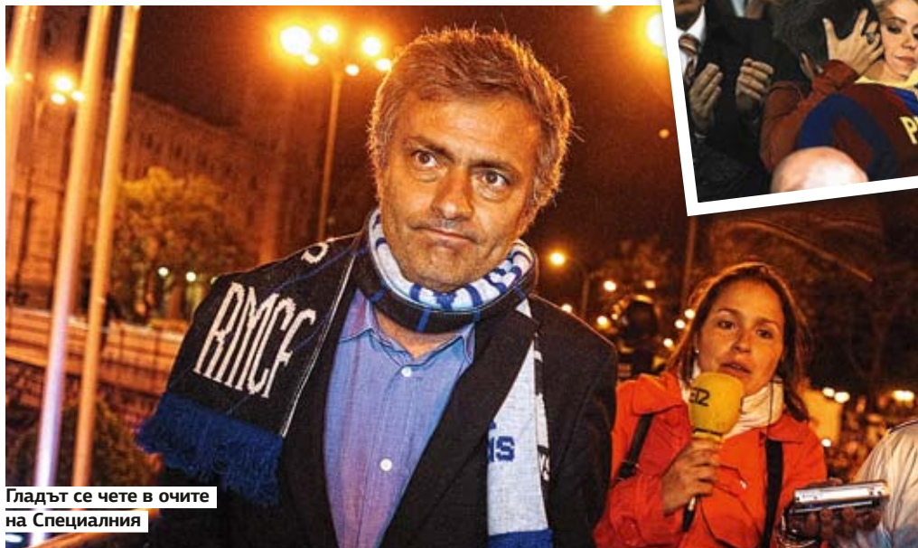
Гладът се чете в очите на Специалния

На 20-ти април, в деня на заминаването ми, отделям фонд от 400 евро за преговорите ми с черноборсаджите. Надеждата ми е свързана с факта, че само седмица по-късно започват битките между двата отбора в Шампионската лига. Освен това 400 евро са малко над една средна работна заплата за България, така че още при тръгването ми вече съм се изсмял в лицето на световната финансова криза. Преди да се кача на самолета, получавам SMS от моя човек в Испания, който цял ден следи местните телевизии. Съобщението му гласи: "Току-що казаха, че във Валенсия има 20 хиляди души, които си търсят билет на черно." Излитам със своето съгъе. Пристигам пред "Местая" в 20:15 местно време, тоест до финала остават час и 15 мин. Решавам да не се бавя и миг повече и започвам с директния маркетинг – някои от феновете са прекалили толкова много със "сервесата" [от исп. – "бира"] и сангрията, че едва ми казват офертите си. Най-шокиращата е тази на трима младежи с тениски на Реал, които искат 1500 евро за един билет. Докато си говорим на смесица от испански и английски, те ми обясняват, че са купили излишния талон с общи пари и са твърдо решени да изкарат по 500 евро печалба от него. Малко покъсно се натъквам на друг фен, който го удря на футболно мъченичество: "Разбери ме, аз обичам Реал Мадрид [при тези думи целува емблемата на фланелката си] и не бих гледал любимия си клуб само в замяна на 1000 евро." Лирическото му